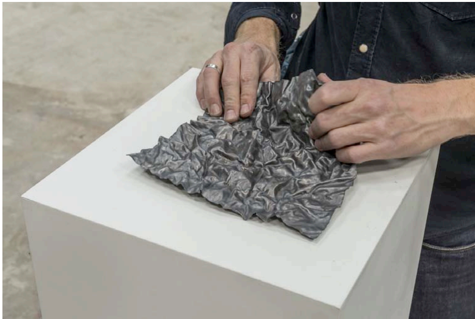
Kader ATTIA, Courtesy GALLERIA CONTINUA, San Gimignano / Beijing / Le Moulin