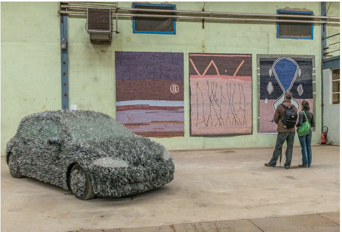
Luca PANCAZZI, Courtesy GALLERIA CONTINUA, San Gimignano / Beijing / Le Moulin et Yann GERSTBERGER (invitation de Dar al-Mam0n)