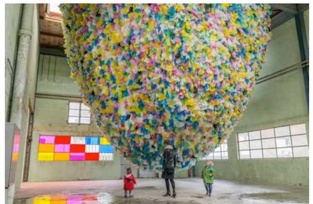
Pascale Marthine TAYOU, Courtesy GALLERIA CONTINUA, San Gimignano / Beijing / Le Moulin