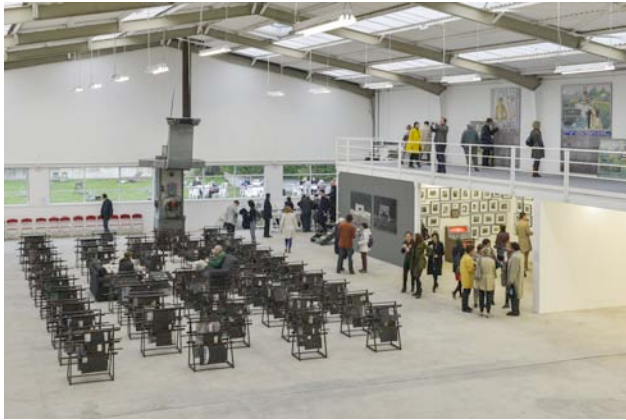
Carlos GARAICOA, Courtesy GALLERIA CONTINUA, San Gimignano / Beijing / Le Moulin